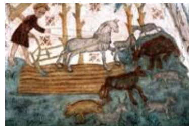
”Adam plöjer” (Historiska mueet)