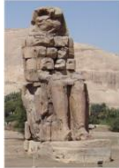
Den grekiska antiken hade rötter i Orienten. I Mesopotamien och Egypten (bilden) uppstod skriftsystem ca 3000 f.Kr.

Romariket var ett väl organiserat rike med väl fungerande kommunikationer och stor handel. Under 400-talet e.Kr. försvagades dock den västra delen av riket med centrum i Rom alltmer. Till sist invaderades denna del av germanska stammar (476 avsattes den siste västromerske kejsaren). Den östra delen, Östrom med centrum i Konstantinopel, fanns däremot kvar i 1000 år till.